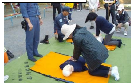
真剣な AED 訓練